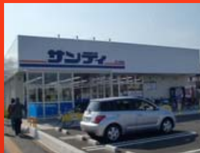
サンディ鶴ヶ岡店 (埼玉県)