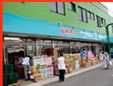
アタック宮久保店(千葉県)