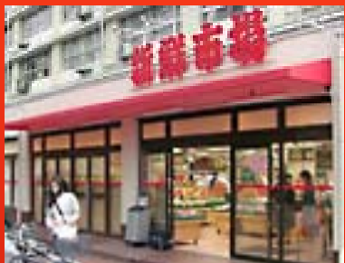
新鮮市場亀戸店 (東京都)